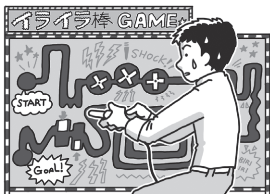
図1 答えじゃなくてルールを学習するイメージのとても重要なアルゴリズム「Qラーニング」をイライラ棒を例に体得 イライラ棒は遊園地やゲームセンターにも置いてあるかも

前回(第15回, 2018年1月号)では, 自動運転や対戦ゲームの元になっている「Qラーニング」について解説しました。このQラーニングは, とても重要ですので, 今回は応用例を紹介し, 理解を深めたいと思います。具体的にはRCサーボモータで作ったロボット・アームを使って, Qラーニングで「正しい動作」を獲得して, 昔テレビで見たことがあるようなイライラ棒をクリアします(図1, 写真1)。