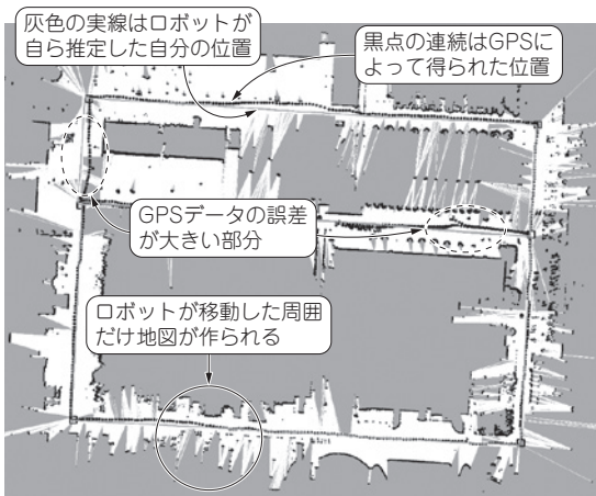
図1 自走ロボで重要な「正確な位置 & 地図」を推定するSLAMの基本