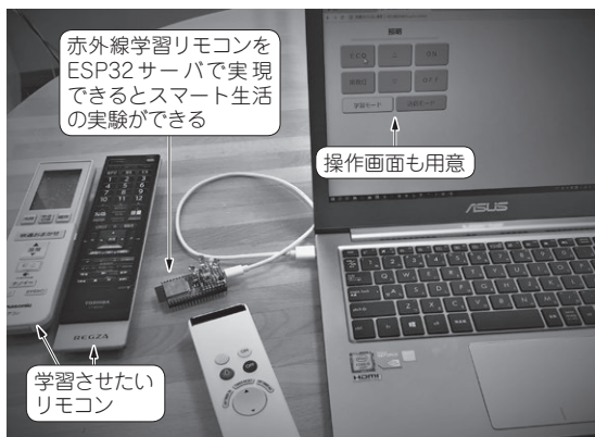
写真1 今回製作するサーバ機能付きESP32赤外線学習リモコン「IRServer」