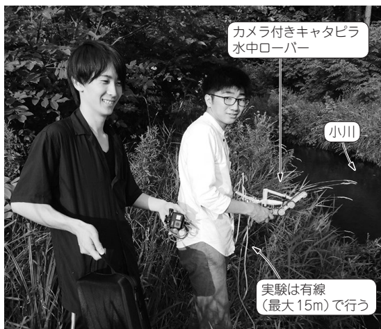
(a) 実際に小川に沈めて実験する