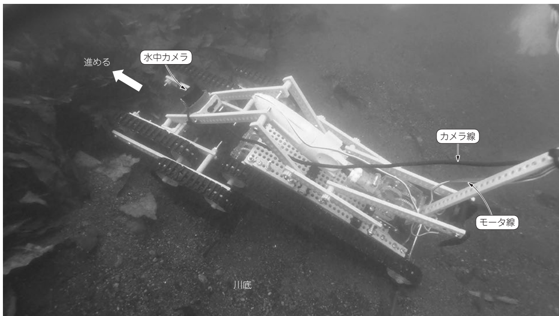
(b) 川底をカメラ撮影しながら進む

写真1 カメラ付き水中走行ローバーに挑戦してみる…浅ければ安定して水中調査が可能