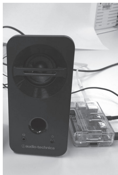
(b) スピーカから電話口で話した警告メッセージが流れる