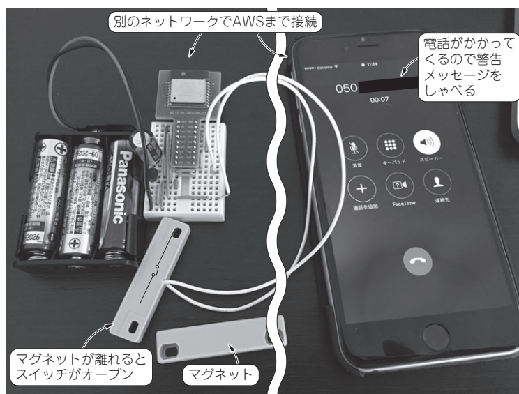
(a) 侵入者アリを電話で通知中