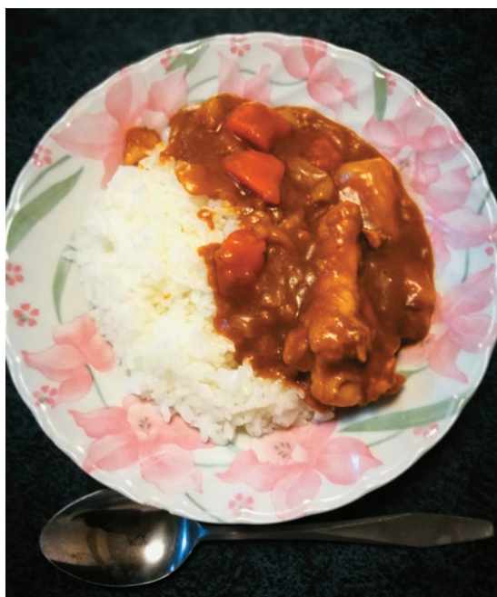
写真2 2時間で出来上がった「2日目の味のカレー」