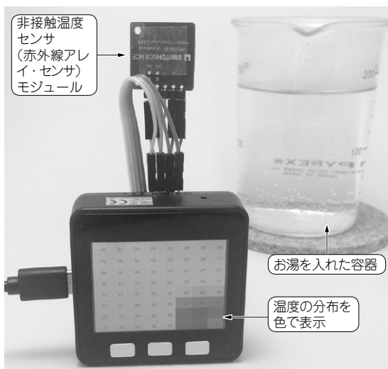
写真1 非接触で離れたところの温度を手のひらデバイスM5Stackに表示してサーモグラフィにする

サーモグラフィ・モジュールとマイコンとは、シリアル・データ(SDA)とシリアル・クロック(SCL)、電源、グラウンドの4本で接続します。マイコン側はESP32の標準になるSDAピン(21番)とSCLピン(22番)につなぎます(図1)。接続にはM5Stackに同梱されていた10芯フラット・ケーブルから4芯分を割いて