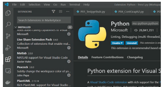
図2 Python プラグインを忘れずにインストールしておく