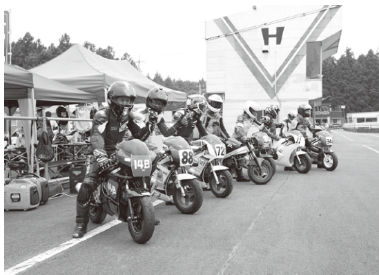
写真1 参加したのは50ccエンジン、スズキGAG限定クラス