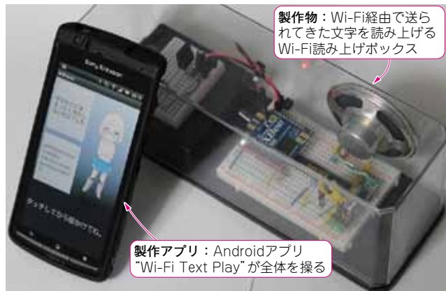
写真1 定番無線モジュールのWi-Fi版であるXBee Wi-Fiとスマホを使ったネットワーク音声認識&読み上げ装置

スマートフォンはAndroid端末。開発したAndroidアプリ「Wi-Fi Text Play」はGoogle Playよりダウンロード可能